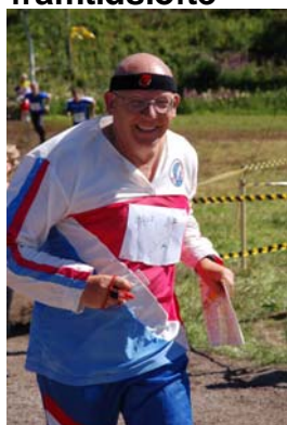
Gammal o glad lovar ingenting