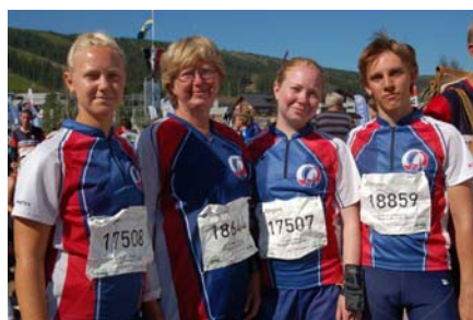
Stolta luffare i ny dräkt