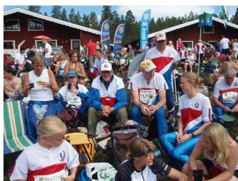
En härlig samling i finvädret