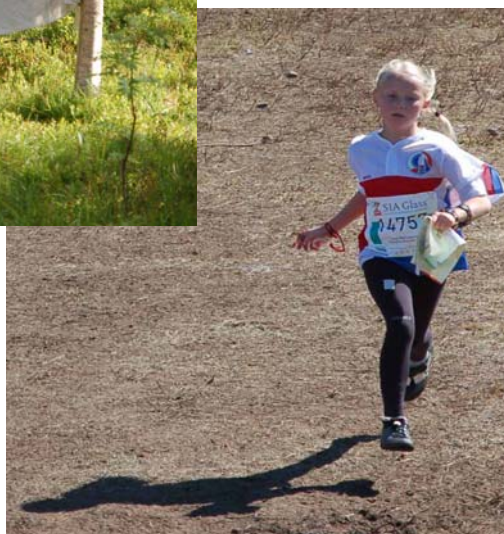
Foto: Malin Skals, Lasse Mongård och Karin Edström. Collage: Per Liljeqvist.