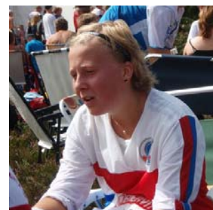
Trött efter en lyckad dag?