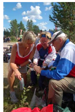
Genomgång av kartan