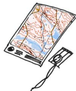
Illustration: Anna Andrén.