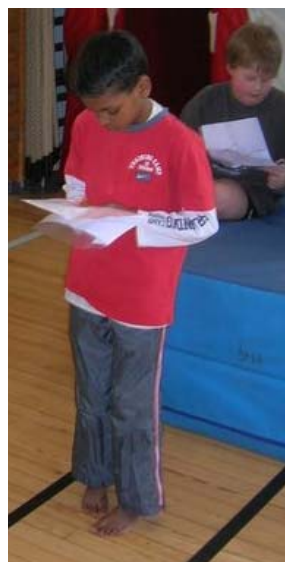
Leo funderar på vägval.