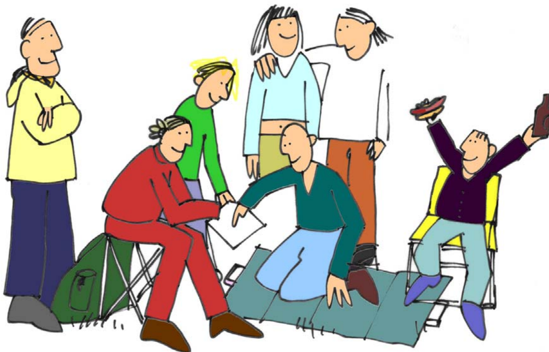
Illustration: Anna Andrén

Den 17-18 maj arrangerar de båda Örebroklubbarna Garphyttans IF och Almby IK två tävlingar, en medeldistans på lördagen och en långdistans på söndagen. Tävlingarna arrangeras vid Blackstahyttan i Kilsbergen i mycket fina orienteringsmarker.