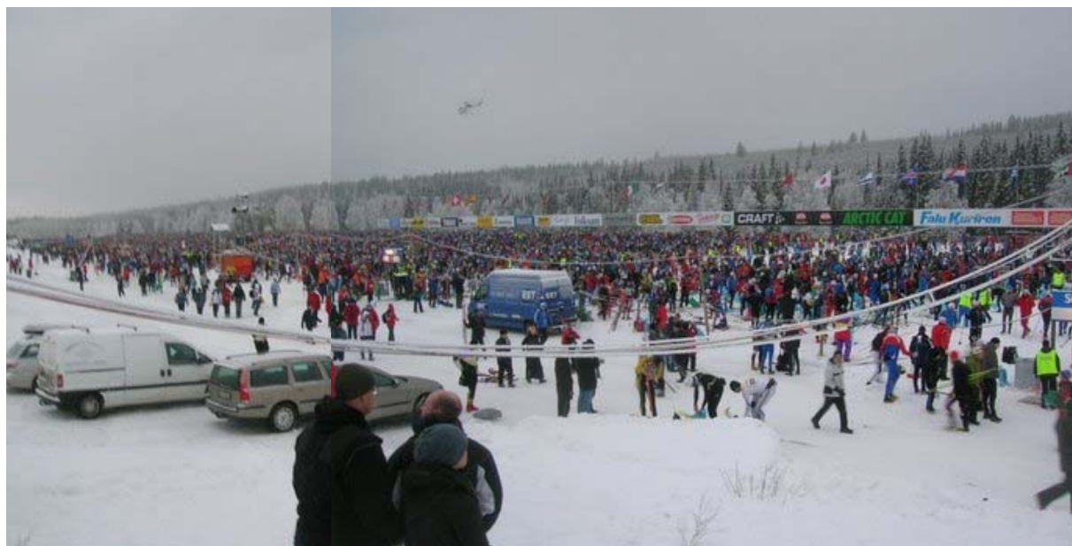
Starten vid årets Vasalopp.