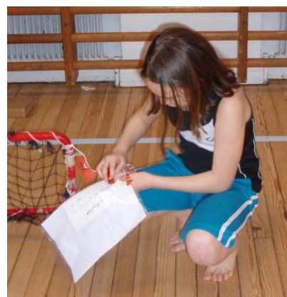
Kornelija gillar verkligen inomhusorientering.