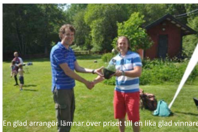
En glad arrangör lämnar över priset till en lika glad vinnare