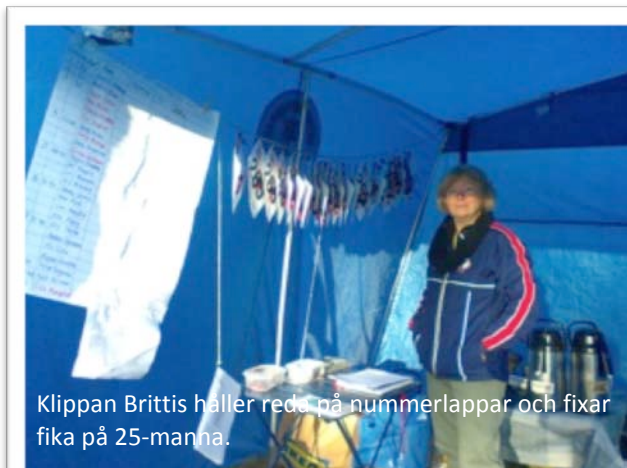
Klippan Brittis håller reda på nummerlappar och fixar fika på 25-manna.

-Vid starten 1974 sprangs alla sträckorna som en traditionell budkavle och på de sista sträckorna behövdes därför pannlampa. Under 80-talet infördes därför att sträcka tre till och med sträcka sju löps med fyra löpare parallellt.